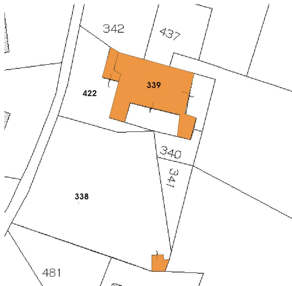
Stralcio di mappa catastale